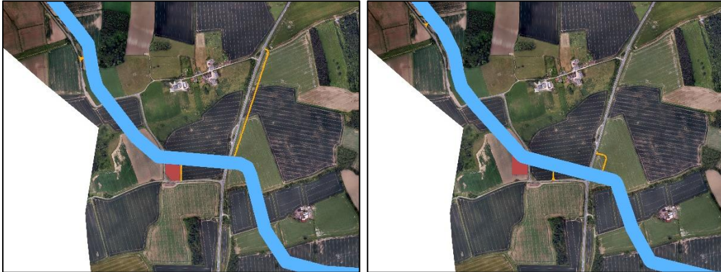
Inset 14: ECC.1.17.; LC.1.6.; TAT.1.14.