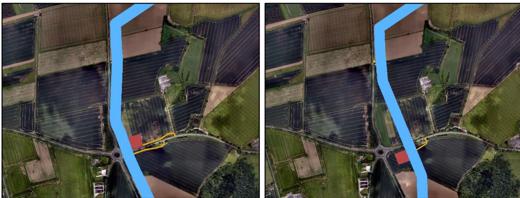
Inset 12: TAT.1.16.