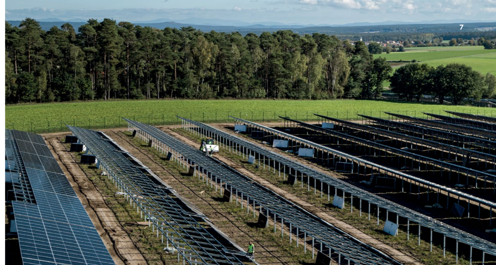
Ein solarer Meilenstein mitten in Bayern: Der Solarpark Altenschwand, Landkreis Schwandorf.

Der starke Ausbau ist auch deswegen sinnvoll, weil Photovoltaik einer der günstigsten Energieträger ist und somit zu den wichtigsten Stromerzeugungsquellen der Zukunft gehört.